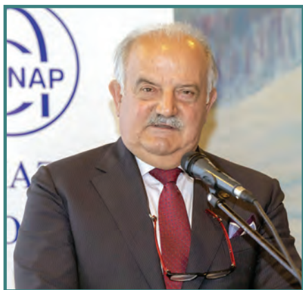
Giampaolo Palazzi Presidente Nazionale ANAP

C on grande piacere colgo l'occasione di rivolgermi a tutti i soci del gruppo territoriale di Udine. Mi è stato chiesto di contribuire all'edizione di questo notiziario, in modo che resti un tangibile ricordo in prossimità del mio termine mandato a seguito del rinnovo delle cariche nazionali che si terrà quest'anno. Ero da pochi giorni stato eletto Presidente nazionale di ANAP, a metà aprile del 2011, quando venni invitato per il vostro congresso in occasione della annuale Festa del Socio del 1° maggio; la ricorderò sempre perché quella fu la mia prima uscita nella nuova veste, tra l'altro in visita ad un gruppo tra i più numerosi d'Italia e tenni il mio primo intervento davanti ad una platea gremitissima come peraltro ho potuto apprezzare la grossa partecipazione tutti gli anni successivi, ai quali non sono mai mancato. Sono stati anni di fattiva e proficua collaborazione con i vostri dirigenti e il vostro gruppo e la vicinanza e la stima reciproca non sono mai mancate. Porgo gli auguri a tutti voi affinché possiate proseguire sulle attività intraprese nel migliore dei modi e perché non perdiate di mira il perno della nostra associazione anche nelle sfide a venire.