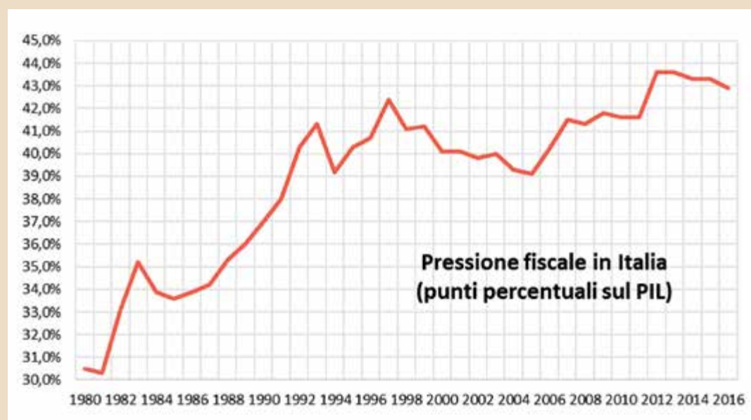
Pressione fiscale, serie storica 1980-2016

Fonte: elaborazioni Ufficio Studi Confartigianato-Imprese Udine su dati Banca d'Italia